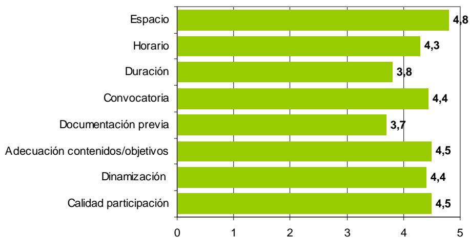
Evaluación Taller Estructuras Familiares y Vulnerabilidad (Puntuación Escala 1-5)

El cuestionario permitía a las personas participantes incluir, de manera abierta, comentarios, valoraciones o sugerencias respecto al taller. Sobre esta pregunta únicamente se recibió la siguiente aportación: “Demasiados temas para muy poco tiempo: apenas da tiempo a debatir con fruto” .